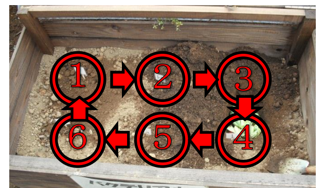
③埋める場所を変えて繰り返します。 (夏場は1週間、冬場は2, 3週間で生ごみが消滅します。)