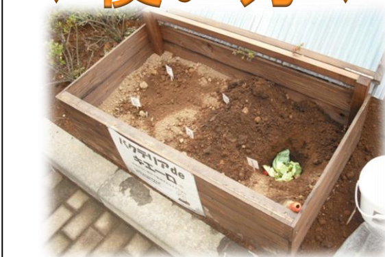
①穴を掘って土に埋める