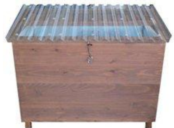
バクテリアdeキエーロ(土置き用底なし)